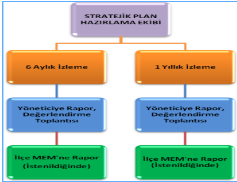
Şekil4. İzleme Değerlendirme

Müdürlüğümüzün 2024-2028 Stratejik Planı İzleme ve Değerlendirme sürecini ifade eden İzleme ve Değerlendirme Modeli hazırlanmıştır. Müdürlüğümüzün Stratejik Plan İzleme-Değerlendirme çalışmaları eğitim-öğretim yılı çalışma takvimi de dikkate alınarak 6 aylık ve 1 yıllık sürelerde gerçekleştirilecektir. 6 aylık sürelerde Üst Yöneticiye rapor hazırlanacak ve değerlendirme toplantısı düzenlenecektir. İzleme-değerlendirme raporu, istenildiğinde Stratejik Geliştirme Başkanlığına gönderilecektir. Ayrıca ilimizin Mülki İdari Amirine sunulacaktır. 1 yıllık izleme-değerlendirme çalışmaları, Stratejik Planımızda yer alan hedeflerin yıllık düzeyde ifade edildiği Performans Programı ve yılsonunda gerçekleşme düzeylerinin belirlendiği Faaliyet Raporu hazırlanarak yapılacaktır. Performans Programı ve Faaliyet Raporu Üst Yöneticinin değerlendirmesinin akabinde Strateji Geliştirme Başkanlığına ve Mülki İdari Amire sunulacaktır. Yıllık izlemelerle ilgili değerlendirme toplantıları düzenlenecektir.