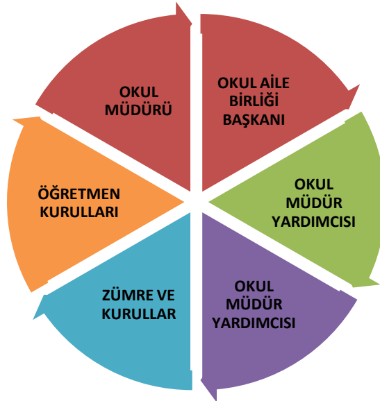
Şekil2. Paydaş analizi